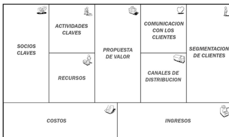
Figura no. 2 (Osterwalder y Pigneur, 2010, p. 42).